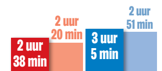
Huishoudelijk werk en kindercare (weekdag)